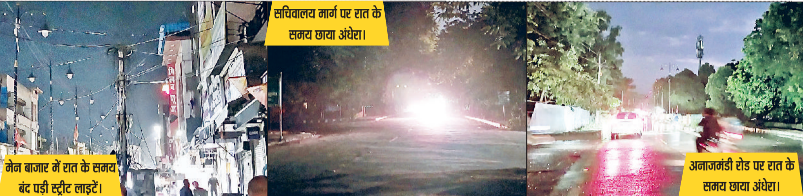
मेन बाजार में रात के समय बंद पड़ी स्ट्रीट लाइटें।