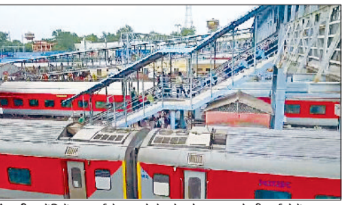
रेवाड़ी। मेटिनेस कार्य के चलते रेलवे स्टेशन पर रोकी गई ट्रेनें।

जंक्शन से होकर बड़ी संख्या में लंबी दूरी की ट्रेनें दिल्ली की ओर निकलती हैं। ब्लॉक लिए जाने के कारण एक डबल डैकर ट्रेन व कई एक्सप्रेस ट्रेनों को स्टेशन पर ही रोक ही दिया गया। इससे इन ट्रेनों में सफर कर रहे यात्रियों को भारी परेशानी का सामना करना पड़ा। यात्री ट्रेन चलने के इंतजार में प्लेटफार्म पर इधर-उधर घूमते हुए नजर आए। ट्रेनों का संचालन सुचारु होने के बाद यात्रियों ने राहत की सांस ली।